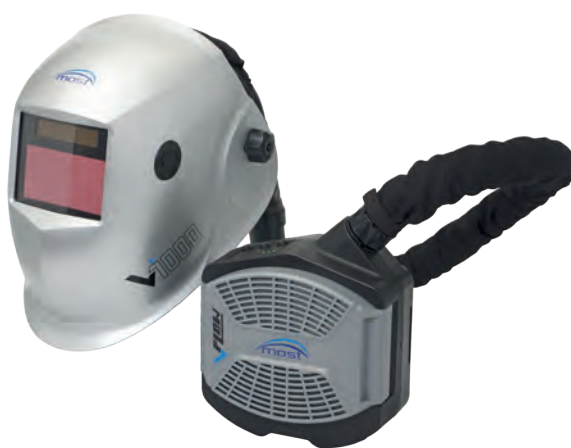
Przyłbica MOST V1000 AIR z MOST V-FLOW / kpl z torbą Nr katalogowy: 72 00 911199