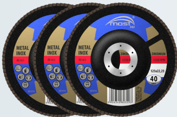
Zestaw 100 szt. tarcz lamelowych MOST PRO Zirconium 125x22 P40 (nr katalogowy 94 12 12611C)