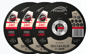
Zestaw 200 szt. tarcz ultracienkich do cięcia MOST PRO 41 125x1,0x22 Metal + INOX (nr katalogowy 94 12 12613C)