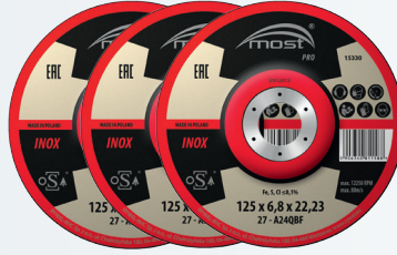
Zestaw 100 szt. tarcz do szlifowania MOST PRO 27 125 x 6,8 x 22 INOX (nr katalogowy 94 12 12615C)