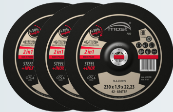
Zestaw 100 szt. tarcz do cięcia MOST PRO 42 230 x 1,9 x 22 Metal + INOX (nr katalogowy 94 12 12614C)