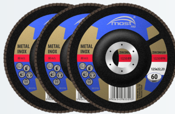
Zestaw 100 szt. tarcz lamelowych MOST PRO Zirconium 125x22 P60 (nr katalogowy 94 12 12612C)